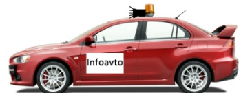
Obveščanje gledalcev - Na progi ni več gledalcev