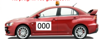
Predtekmovalna vozila - 20 minut pred prvim tekmovalcem; Na progi ni več gledalcev