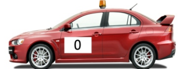
POZOR , tekmovanje se začne čez 10 minut Popolna prepoved gibanja po progi!!!!