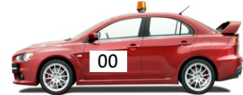
Predtekmovalna vozila - 15 minut pred prvim tekmovalcem; Na progi ni več gledalcev