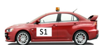
Kontrola varnosti na hitrostni preizkušnji - 30 minut pred prvim tekmovalcem; Na progi ni več gledalcev!!