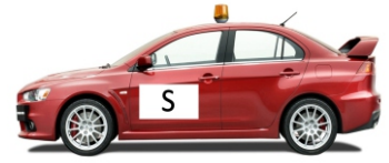
Varnostno vozilo - kontrola varnostnega načrta in zapiranje proge - 1 uro pred prvim tekmovalcem