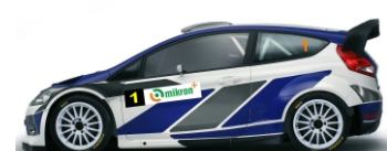
Tekmovalna vozila Gibanje po progi popolnoma prepovedano!!!