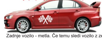
Zadnje vozilo - metla. Če temu sledi vozilo z zeleno zastavo ali lučjo, je proga odprta.